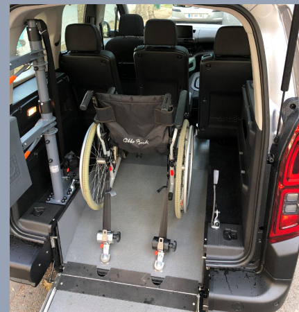
2 sièges individuels SMARTSEAT en 2 ème rangée. Espace entre les 2 sièges : 610 mm La personne en fauteuil roulant est donc proche des autres passagers.