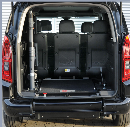
Système Easy-Flex breveté, la rampe se rabat et devient le fond de votre coffre.